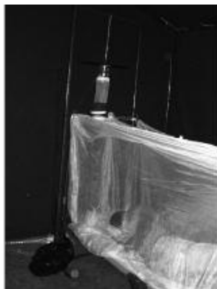
Moustiquaire et piège